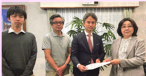
市長に申し入れ。左からたゆ、水上、各市議、一人おいて森戸市議

市長からは、「国からのメニューを各課に照会している。各課と相談していくことになる。」と回答しました。